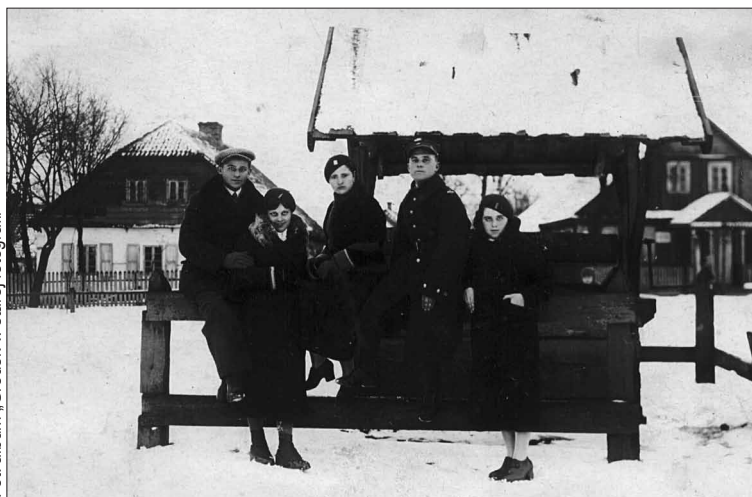
Pamiątkowe zdjęcie przy studni na Placu 11 listopada.

macja, że jeszcze przed 26 września 1927 roku uchwalono regulamin sanitarno – porządkowy dla mieszkańców miast i miasteczek, w tym Gródka. Ponieważ Gródek