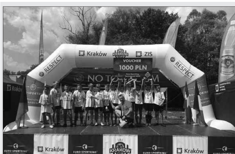
Fot. fb USS Gryfik w Gródku