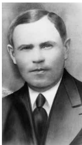
Ojciec autorki listu

Jestem miłośniczką gazety „Wiadomości Gródeckie”. Czytam z przyjemnością po kilka razy artykuły lub ogłoszenia, które przypominają lata spędzone w Gródku.