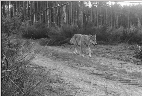
Zdjęcie z fotopułapki