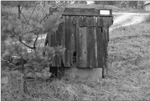
Stara studnia w Waliłach-Stacji

Przeglądając strony internetowe pewnego razu natrafiłam na pewną lokalną ciekawostkę. Pod adresem facebook.com/HistoriaLudzieWydarzenia znalazłam kilka ciekawych historycznie fotografii oraz notatek. Jedną z nich, z 17 marca 2016 roku, postanowiłam zacytować czytelnikom „Wiadomości Gródeckich”.